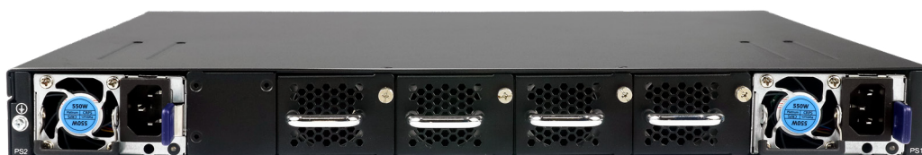
PK900-32C - Vista traseira