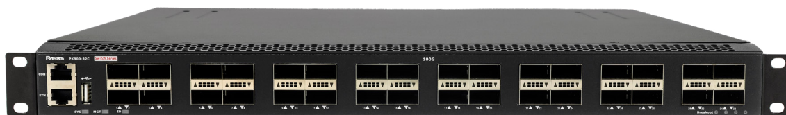
PK900-32C - Vista frontal