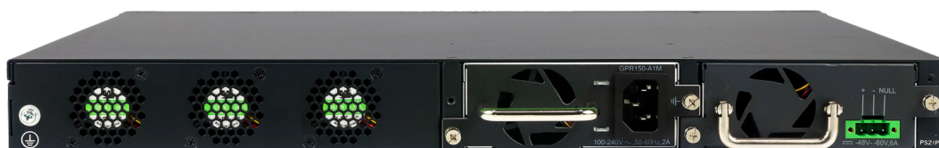
PK800-24X2C - Vista traseira