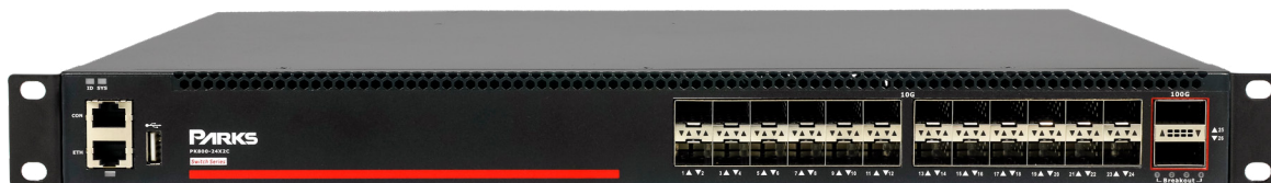
PK800-24X2C - Vista frontal